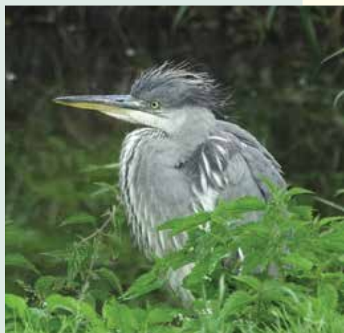
Rezerwat Czaplinciec - Czapla Siwa

GMINA WĄWOLNICA , położona nad rzeką Bystrą, w otulinie Kazimierskiego Parku Krajobrazowego. W przeszłości przebiegały tędy szlaki handlowe ze wschodu na zachód, dzisiaj prowadzą tu szlaki pątnicze do sanktuarium Matki Bożej Kębelskiej.