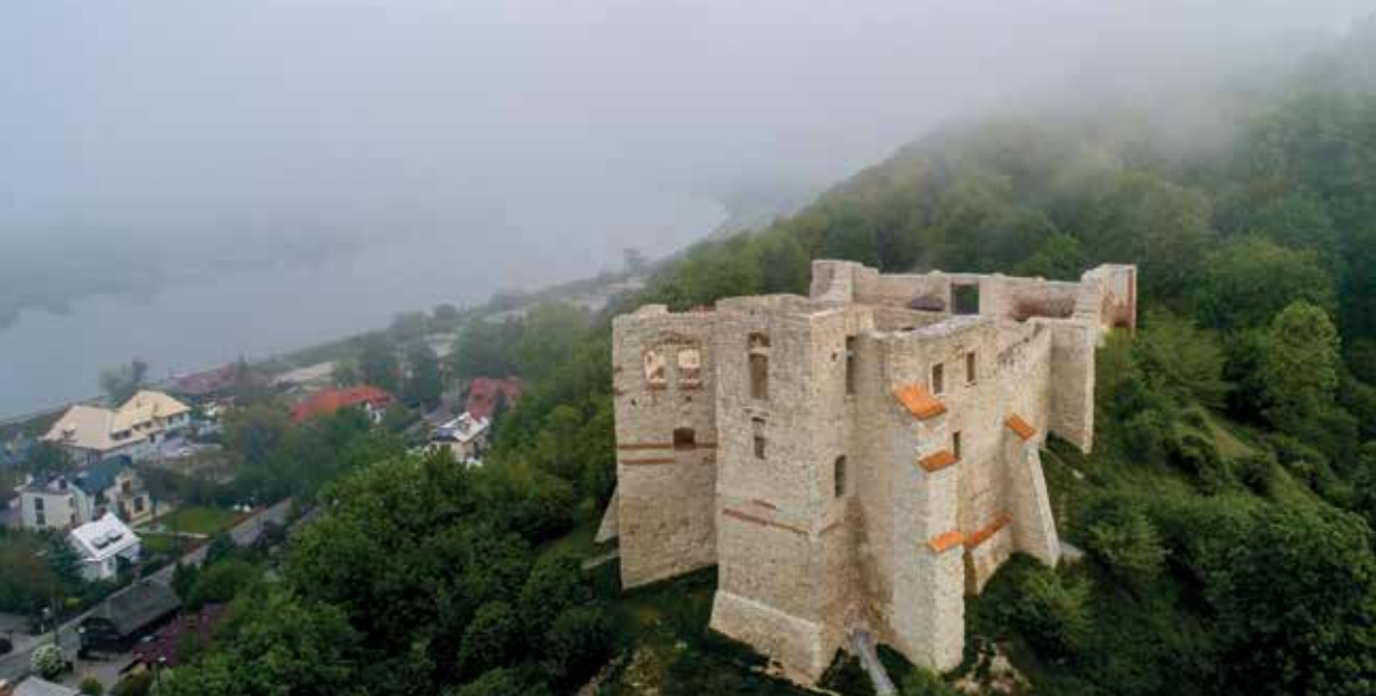
Zamek w Kazimierzu Dolnym

Kraina Lessowych Wąwozów położona jest w zachodniej części województwa lubelskiego na Wyżynie Lubelskiej i obejmuje fragment Płaskowyżu Nałęczowskiego, Równiny Bełżyckiej, wschodni skraj Równiny Radomskiej oraz Małopolski Przełom Wisły. Wyróżnia się bogactwem nieskażonej przyrody, obfitującej różnorodnością form przyrodniczych, skupionych w parkach krajobrazowych, rezerwatach i obszarach objętych ochroną w ramach programu Natura 2000. Cechą szczególną, jest zagęszczenie sieci lessowych wąwozów, jarów i parowów, dochodzących do 30 m głębokości, a w niektórych miejscach przekraczających 10 km na 1 km kw.