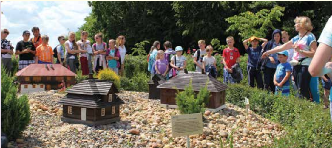
Park Labiryntów i Miniatur

Park Edukacyjno-Rekreacyjny Owadolandia w Wojciechowie oferuje zwiedzającym repliki owadów o wielkości człowieka. Zaletą eksponatów jest odtworzenie ich z precyzyjną dokładnością anatomiczną. Ekspozycji towarzyszą prelekcje na temat życia owadów. Dodatkowym atutem parku są ścieżki tematyczne i plac zabaw z tyrolką.