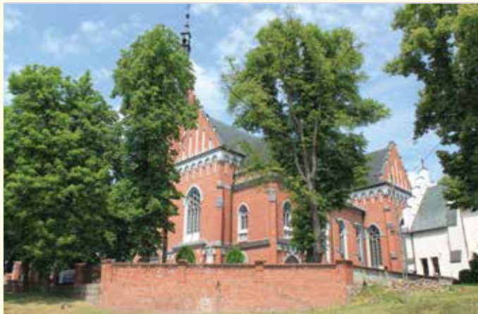
Kościół św. Wojciecha w Wąwolnicy

WĄWOLNICA , jedno z najstarszych miast na Lubelszczyźnie, co potwierdza dokument z 1027 r. przechowywany w klasztorze na Świętym Krzyżu.