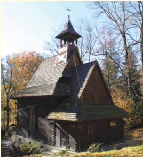
Kaplica św Karola Boromeusza