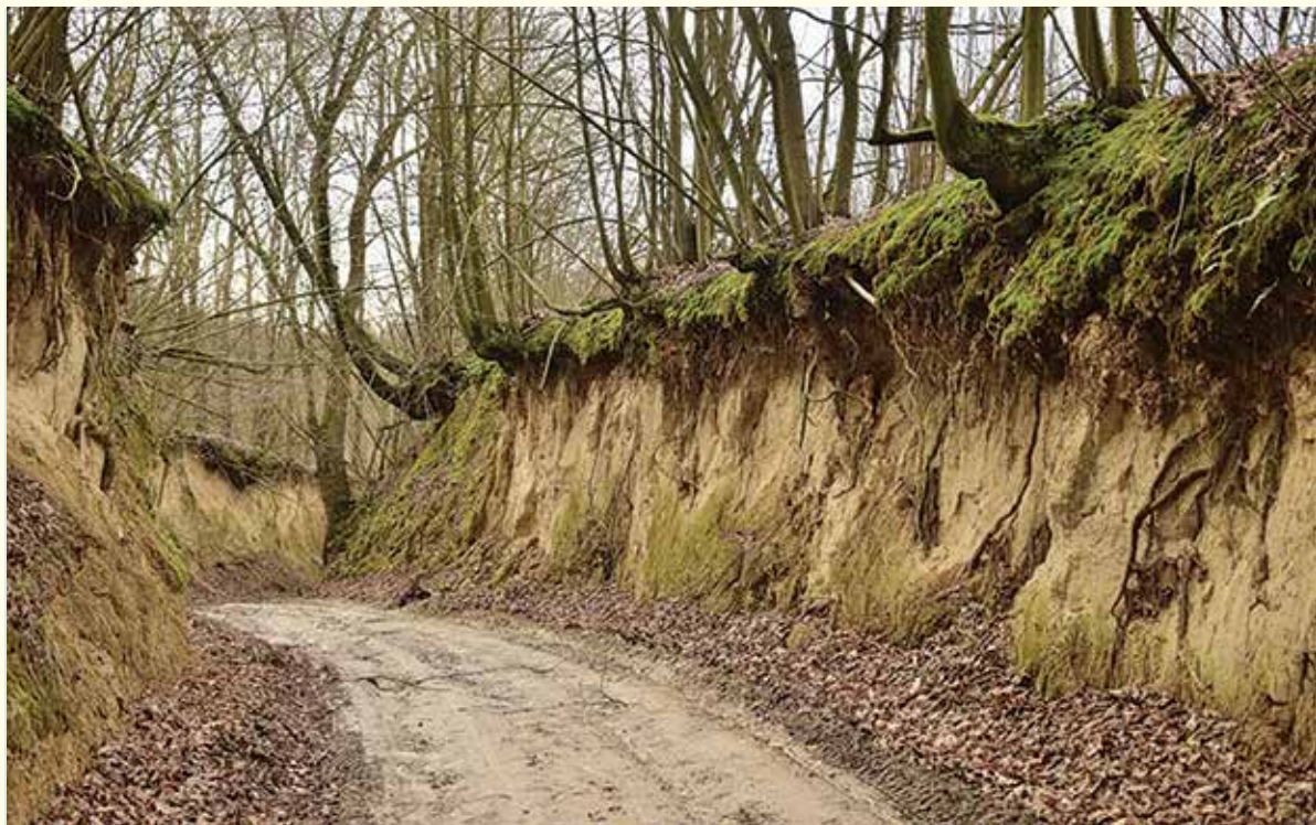
Wąwóz Olszowy Dół w Parchatce