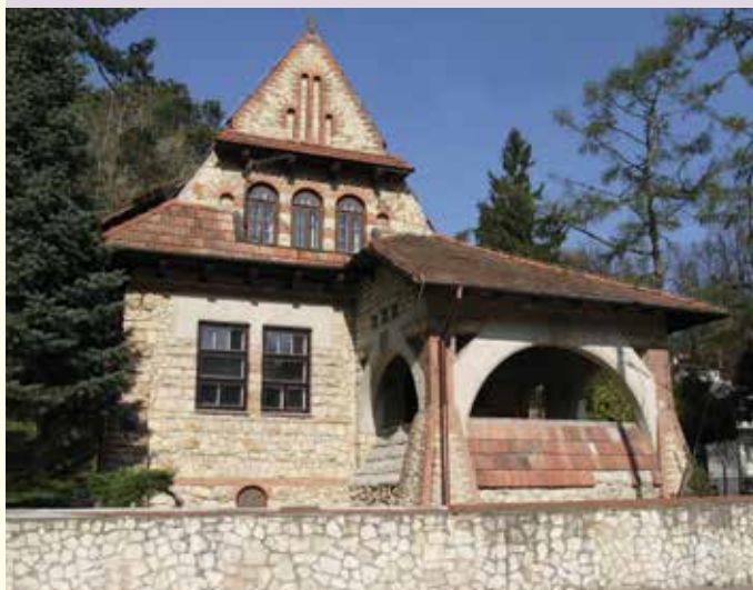
Muzeum Bolesława Prusa - Ochronka A. Żeromskiego

ul. Stanisława Augusta Poniatowskiego 39, tel. 81 501 45 52