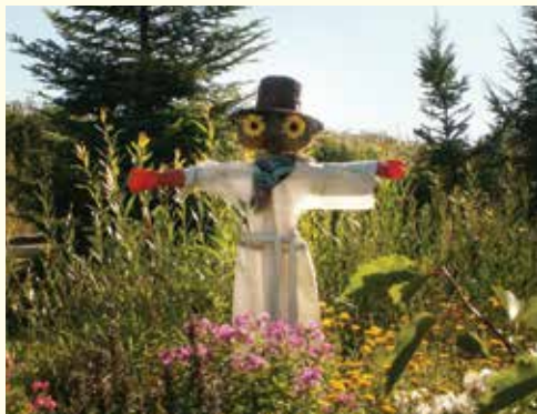
Lessowa Pięciolinia Turystyczna