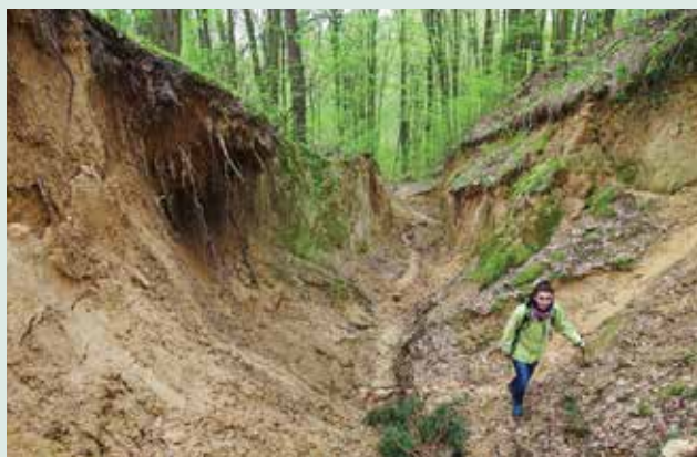
Wąwóz na ścieżce Skrzykowy Dół w Kluczkowicach