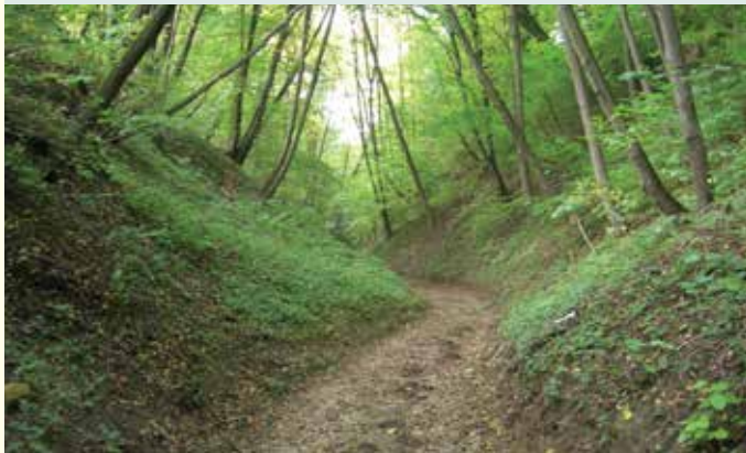
Wąwóz Lipcyk w Nowym Gaju

OLSZOWY DÓŁ W PARCHATCE (gm. Puławy) znajduje się za stokiem narciarskim „Parchatka”. Wąwóz w formie parowu o suchym dnie, posiada urwiste zbocza ze zwisającymi, oryginalnie skręconymi korzeniami drzew.