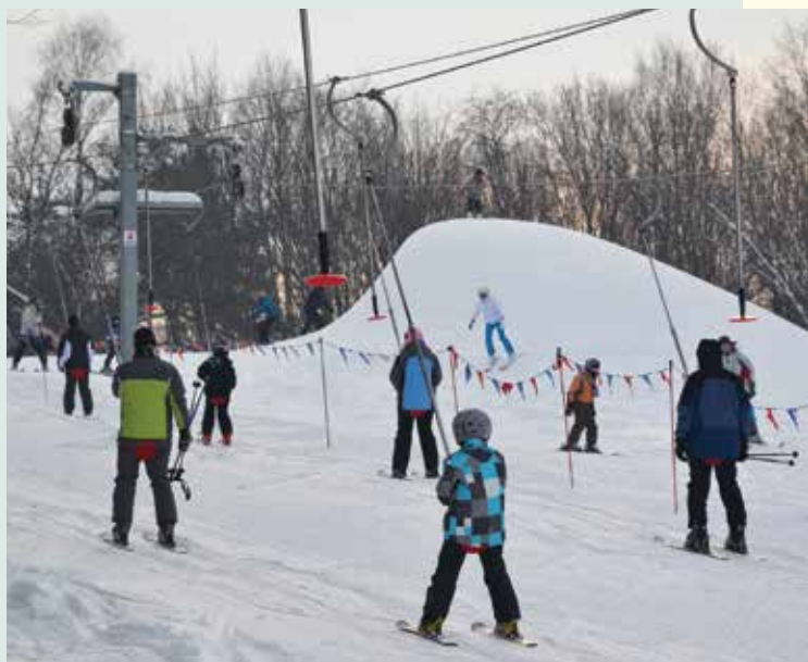
Wyciąg narciarski w Rąblowie