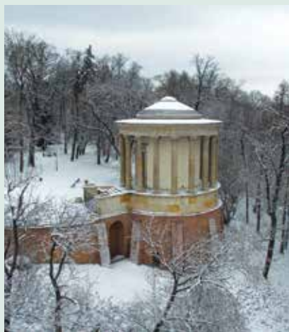
Świątynia Sybili w Puławach

Stok narciarski w Celejowie doskonały dla początkujących narciarzy ze względu na długie, bezpieczne trasy zjazdowe