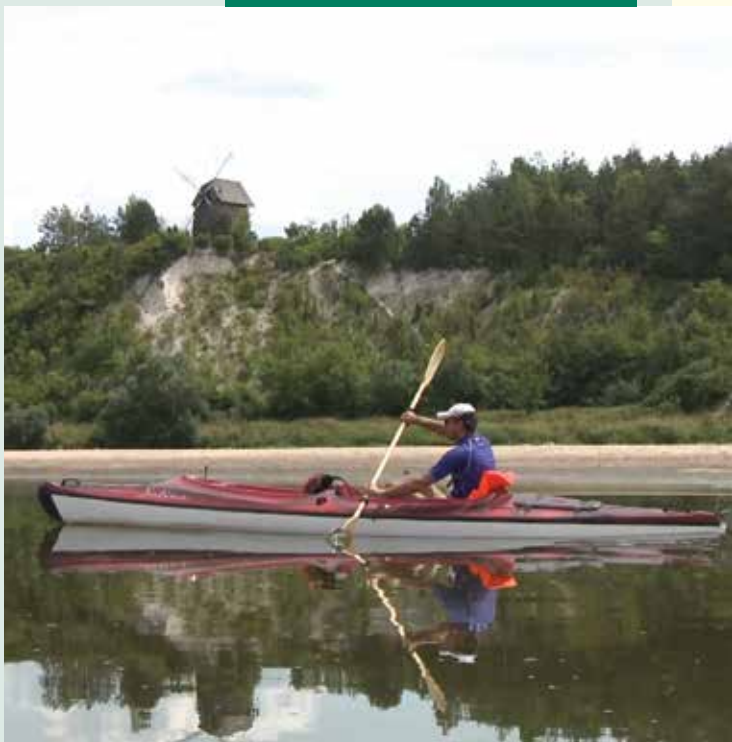
Kajaki na Wiśle okolice Kazimierza Dolnego