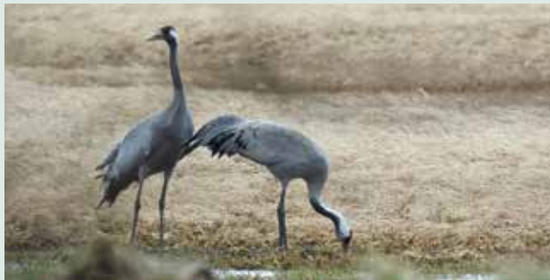
Rezerwat Czaplinciec - Żurawie

Trasa czerwona (13,2 km) biegnie od przejazdu kolejowego w Gołębiu przez bór sosnowy, łąki bonowskie, obok nieistniejącej wsi Bonów (wysiedlonej w latach 1936-1937), do faunistycznego i wodnego rezerwatu Czaplinciec, siedliska czapli siwej.