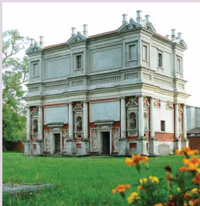
Kaplica Loretańska w Gołębiu

W Górze Puławskiej na uwagę zasługuje kościół parafialny pw. św. Wojciecha , wybudowany z fundacji książąt Czartoryskich, reprezentujący styl barokowo-klasycystyczny. Najstarszym fragmentem pierwotnego wystroju są drzwi do skarbcza z XVIII w. W skład kompleksu kościelnego wchodzi dzwonnica oraz plebania.